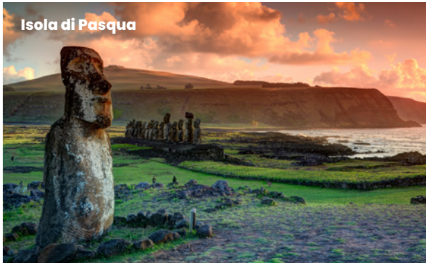
Isola di Pasqua