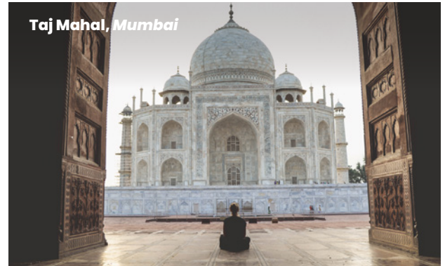
Taj Mahal, Mumbai