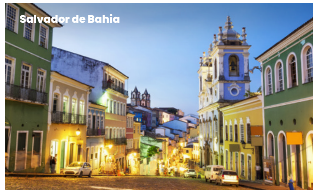
Salvador de Bahia